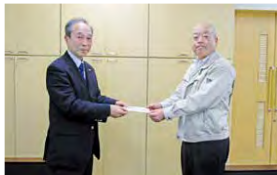
石川ライオンズクラブ