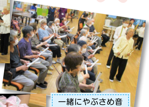
一緒にやぶさめ音頭を踊りました♪