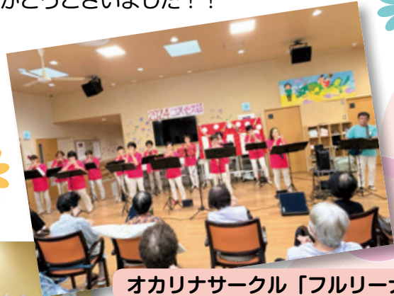
オカリナサークル「フルリーナ」